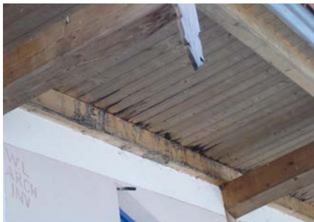
Cantiere dopo 5 anni di vita

MANCA LA TENUTA ALL'ARIA! Tetto passante verso l'esterno, serve una corretta progettazione.